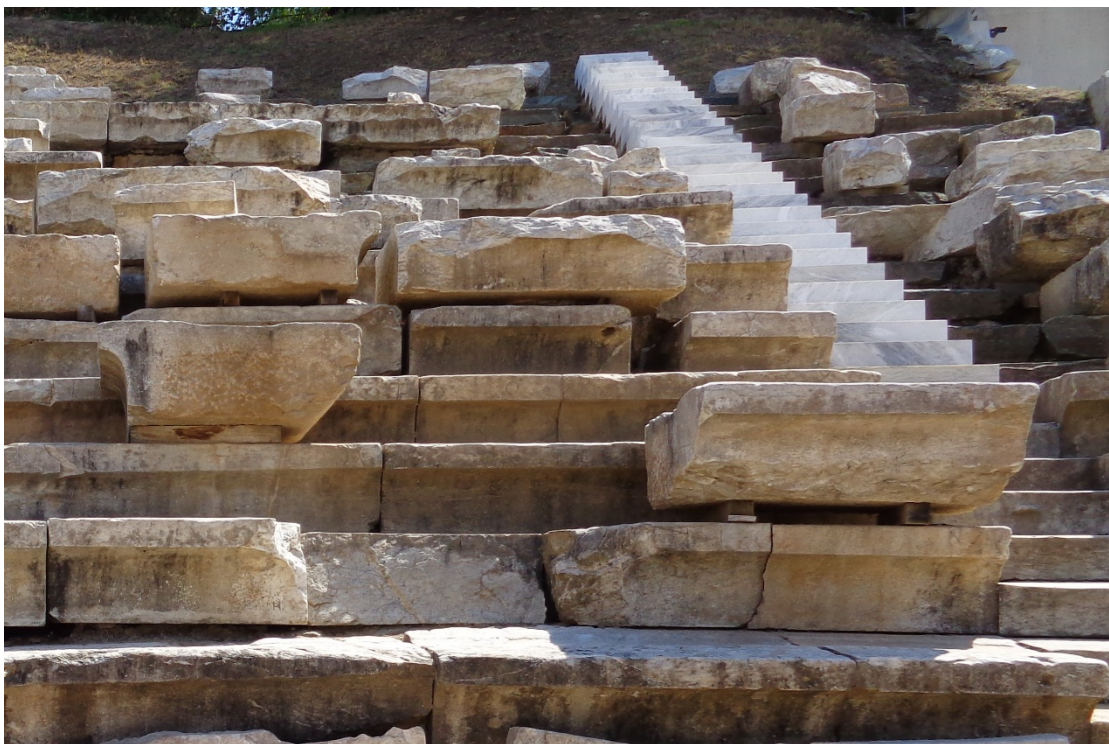
Αρχαία εδώλια στο χώρο του κυρίως θεάτρου

Το Α' Αρχαίο Θέατρο Λάρισας κατασκευάστηκε στις αρχές του 3ου αιώνα π.χ. και αποτελεί εμβληματικό μνημείο της Θεσσαλίας. Στα πλαίσια της αποκατάστασής του με το έργο «Αποκατάσταση Αρχαίου Θεάτρου Λάρισας – Ε φάση», προβλέπεται η τοποθέτηση 240 νέων αρχιτεκτονικών μελών (εδωλίων) στο χώρο του κοίλου, κατασκευασμένων από μάρμαρο παρόμοιο σε φυσικές και μηχανικές ιδιότητες με αυτό των αρχαίων εδωλίων. Τα νέα εδώλια θα προκύψουν από επεξεργασία των όγκων μαρμάρου που έχουν επιλεγθεί στα πλαίσια του Υποέργου 2, σε παντογράφο υψηλής ακρίβειας. Η γεωμετρική μορφή, οι διαστάσεις και αρχιτεκτονικές λεπτομέρειες των νέων μελών έχουν προκύψει μετά από σάρωση όλων των επιφανειών με laser scanner και τη δημιουργία τρισδιάστατων ψηφιακών μοντέλων για το κάθε ένα, στα πλαίσια του Υποέργου 3.